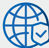
IT en cyber security