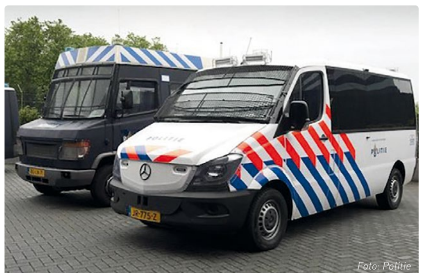
Nieuwe witte ME-busjes vervangen de donkerblauwe bussen.