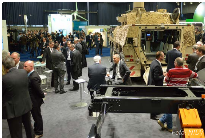
Voor de 27e keer staat op 19 november het complete veiligheidsdomein op de mat: ruim 130 bedrijven verdeeld over drie hallen.

De deelnameprijs is afhankelijk van de standgrootte. Voor info en deelname: www.nidv.eu